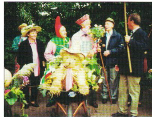
Farbenfroh und mit viel Liebe zum Detail hatten die Kleingärtner ihre Schubkarren und sich selbst geschmückt.

Das Herbstfest im KGV Piel's Kull war wieder ein voller Erfolg. Der Vorstand dankt hiermit allen Helfern und den beteiligten Vereinen.