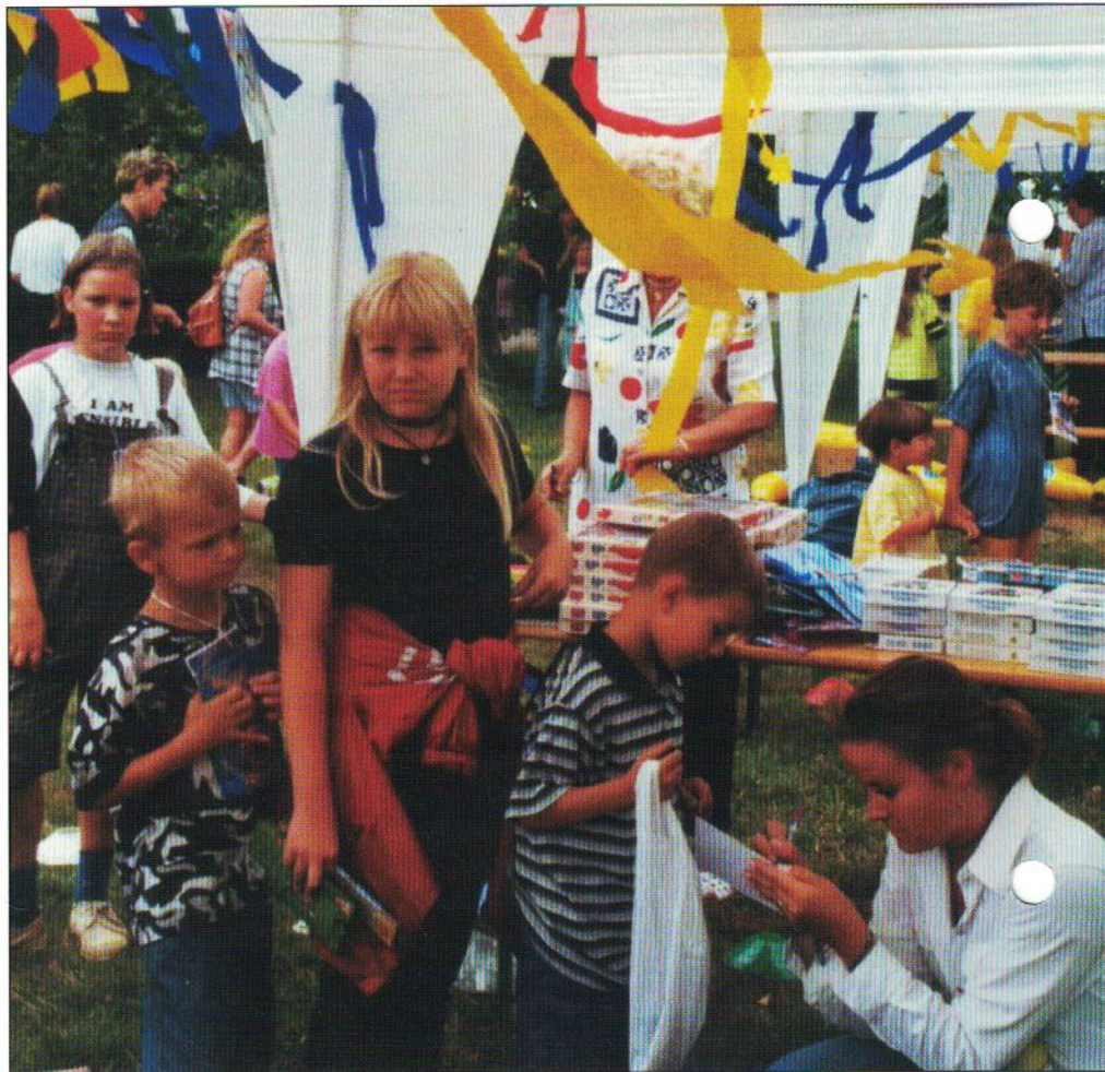
Beliebt ist jedes Jahr das Kinder- und Sommerfest des Vereins.